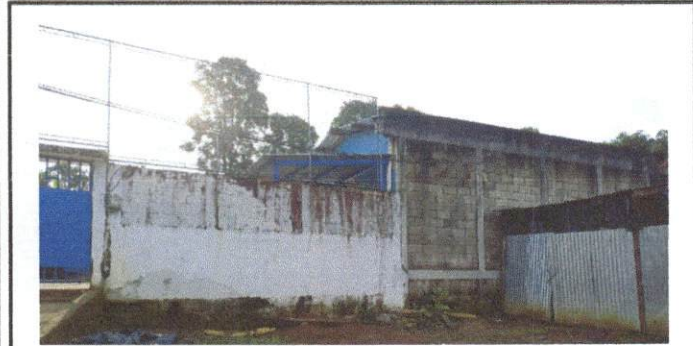
Foto1: Repello en muro