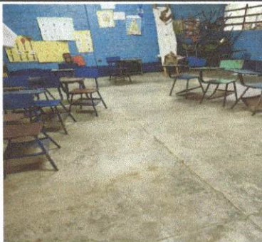
Foto 5: Sustitución de piso de cemento liquido (por piso de granito).