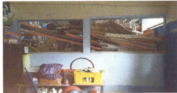
Foto 4: Fabricación e instalacion de balcones de hierro en ventana