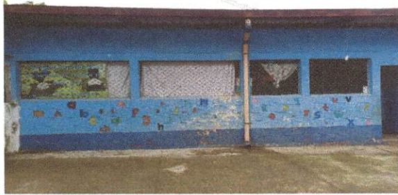
Foto 3: Fabricación e instalacion de balcones de hierro en ventana