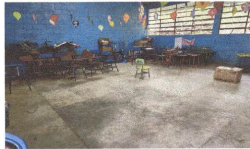
Foto 6: Sustitución de piso de cemento liquido (por piso de granito).

Observación: Si es necesario se pueden agregar hojas adicionales y actualizar el número de hojas.