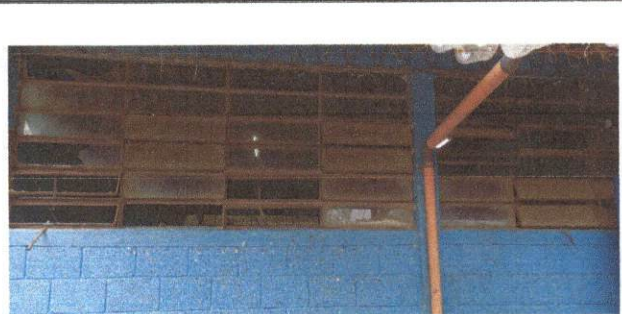
Foto 2 : Fabricación e instalacion de balcones de hierro en ventana