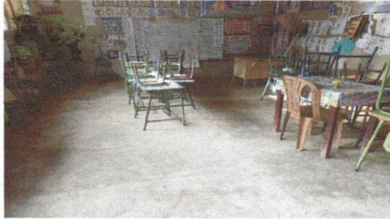
Foto 7: Sustitución de piso de cemento líquido (por piso de granito).